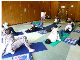
ベビーコース (はいはいコース)