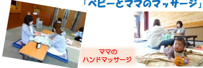
ママの ハンドマッサージ