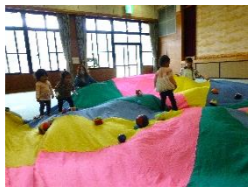
のびのびコース (よちよちコース)