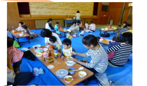
「お誕生会」では、さつまいもカレーを作っていました！