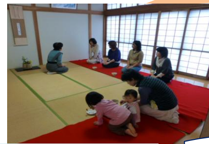
「ちゃちゃちゃ会」では、いももちを作っていました！