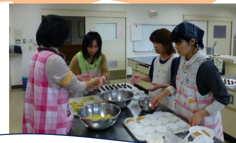
ママボランティアさんが美味しくクッキング