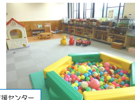
子育て支援センター