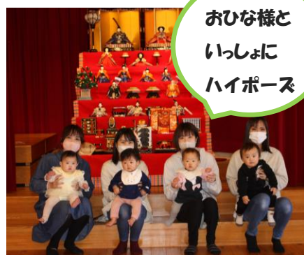
おひな様と いっしょに ハイポーズ