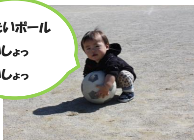
大きいボール よいしょ よいしょ