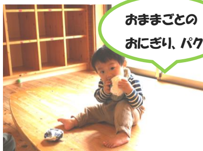
おままごとの おにぎり、パク