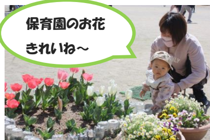
保育園のお花 きれいね～