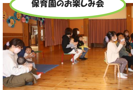
保育園のお楽しみ会