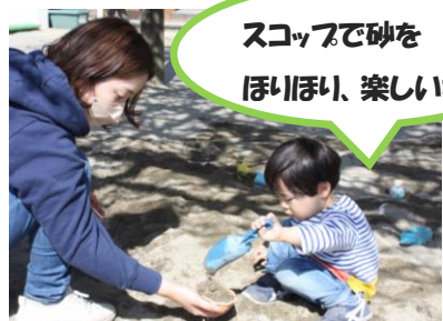
スコップで砂を ほりほり、楽しいな