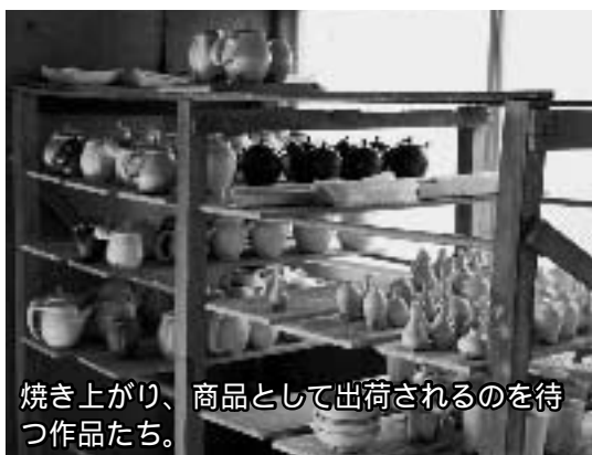
焼き上がり、商品として出荷されるのを待つ作品たち。