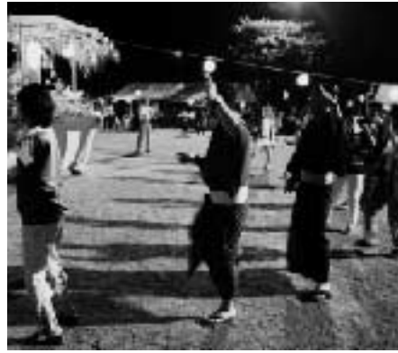
8月7日 川添地区夏祭り