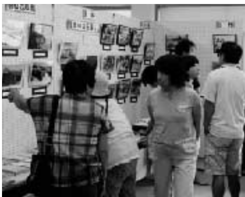
写真に見入る来場者

期間中の来場者は約400人。来場者からは「昔の写真を見ると暮らしの中の楽しみが思い出され、物的には貧しかったが、心は満たされていたなと思った。」「今の風景とは全く違った。見たこともない風景を見ることができた。」「昔の生活が分かる家庭用品や本の展示も見たい。」など、多くの感想が寄せられました。