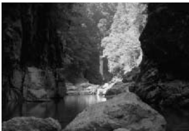
シシ淵から望むニコニコ滝