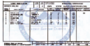
「学期ごとに両親へ送られる成績報告書」

それぞれの教育制度では、必ず短所や長所があります。大事なのは、お互いの長所を学び、採用することです。