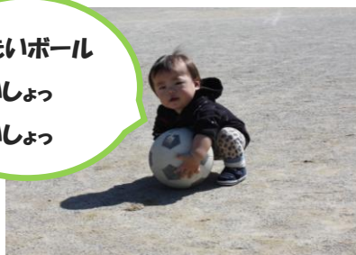
大きいボール よいしょ よいしょ