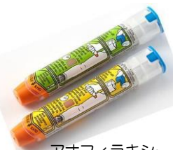
アナフィラキシー 補助治療剤 エピペン注射液