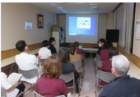
全職員が参加した 勉強会の様子