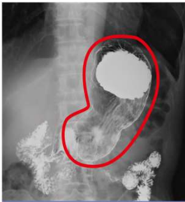
ゲップを出してしまい、胃が萎んだ写真