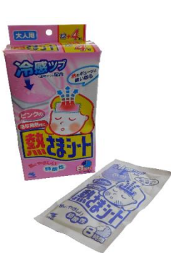
熱吸収・発散シート

昔はおでこに手拭いや「氷のう」を乗せたものですが、現在はシートタイプのものを貼り付けるだけで済むといったようにお手軽になりました。身体に使えるものも出てきました。除菌シートは様々流通しているなかでも、かさ張らず携帯しやすいものを求めたほうがよいでしょう。細かいところまで行き届くようにとウェットタイプの綿棒まで出ているのには少し驚きました。