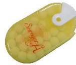
ケース入り胃腸薬 (糖衣錠)