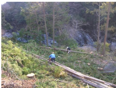
小滝地区での作業風景