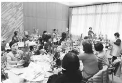
▲アレンジフラワー教室の様子

12月25日(水)子育て支援センターの登録ボランティアの方々に、お正月のアレンジフラワー教室を通して、交流を深めていただきました。