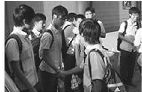
やんじょんこうこう しゅつぱつ あさ 養正高校にて出発の朝 たんどう おおだいちょうしんけんきょういくけんきゅうきょうぎかい 担当：大台町人権教育研究協議会

ぶんかはいけい こと ひと せいかつ わたし じょうしき あいて 文化背景の異なる人と生活してみると、私たちの常識が相手の じょうしき おな にほんじん どうし 常識でないということがよくわかります。同じ日本人同士であつ ても、せいべつ ねんれい しょくぎょう しゃかいてきたちば しゅっしんち ちが ぶん 性別、年齢、職業、社会的立場、出身地の違いなどから文化 か ちが かん ぼめん おお いぶんか ぞんざい じつ 化の違いを感じる場面があり、多くの異文化が存在することを実