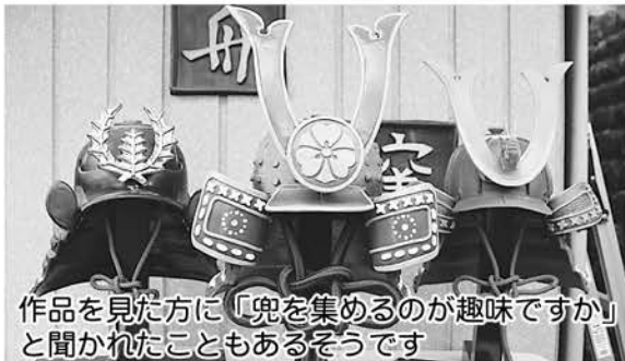
作品を見た方に「兜を集めるのが趣味ですか」と聞かれたこともあるそうです

今では作品の種類も増え、お皿・湯のみ・花瓶といったものから、兜・焼酎サーバー・優勝