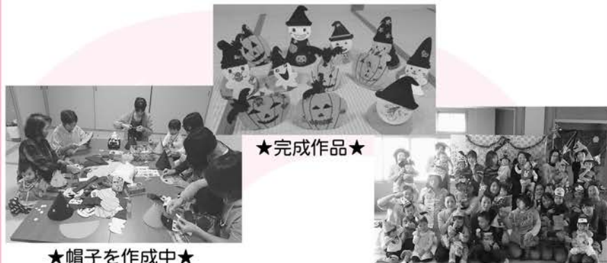
★帽子を作成中★ 会話も弾みます!!

それぞれに工夫したかぶり物を作り、持ち寄った衣装で仮装をして、撮影を行いました。