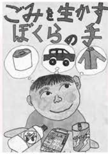
特賞 上野数史 (三瀬谷小)