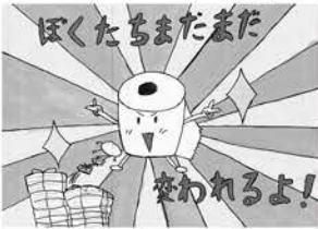
特賞 山本佳奈 (日進小)