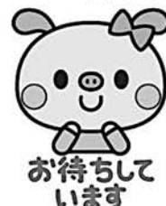
お待ちしております

この機会にがん検診を受診してみたいかでしょうか? 詳細を聞きたい方、希望される方は、12月12日 (木)までに、子育て支援センターにご連絡ください。