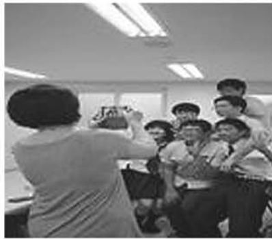
ホストファミリーと

どう さんか がつ すばるがく 動に参加し、8月は昂学 えんこうこう せいと にん やんじょん 園高校の生徒5人が養正 こうこう ほうもん 高校を訪問してホームス