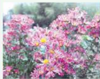
天ヶ瀬 永田重市さん宅 のキク