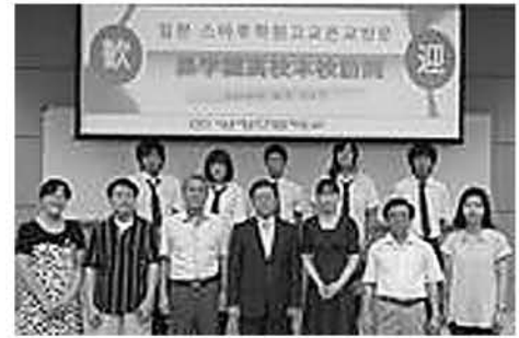
やんじょんこうこう かんげいしき 養正高校にて歓迎式

すばるがくえんこうこう かんこく し やんじょんこうこう ねん 昂学園高校は韓国ソウル市の養正高校と2004年 しまいこうていけい むす がつ やんじょんこうこう から姉妹校提携を結んでいます。7月には養正高校の せいと にん すばるがくえん りょう しゅくはく じゅぎょう ぶかつ 生徒8人が昂学園のきらら寮に宿泊をして授業や部活