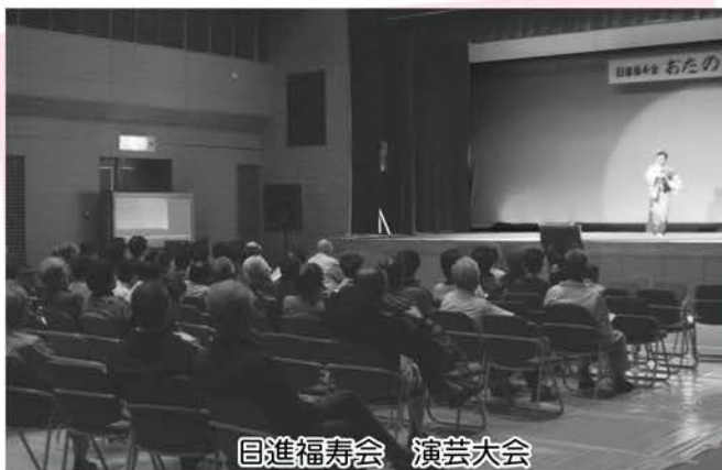
目進福寿会 演芸大会

の参加者は奥伊勢パーキングエリアまで歩き、ウォーキングを通じた健康促進について学びました。