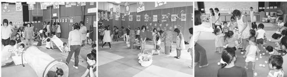
登ってくぐって楽しいな♪ 果物狩りにおでかけ♪ ボランティアのサポート♪

9月27日(金)健康ふれあい会館で、「なかよし運動会」を開催しました。大勢の親子が参加し、体を動かして親子のスキンシップ、母子交流を楽しみました。