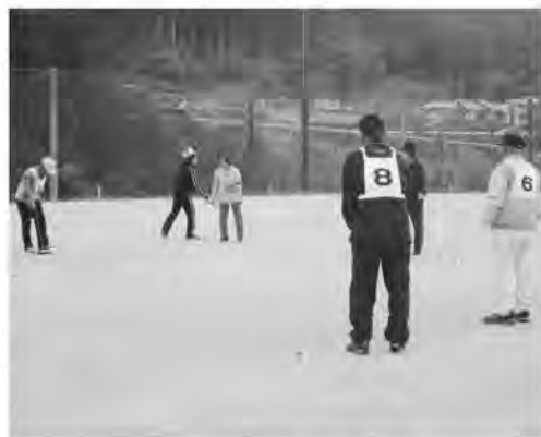
ゲートボール大会の様子