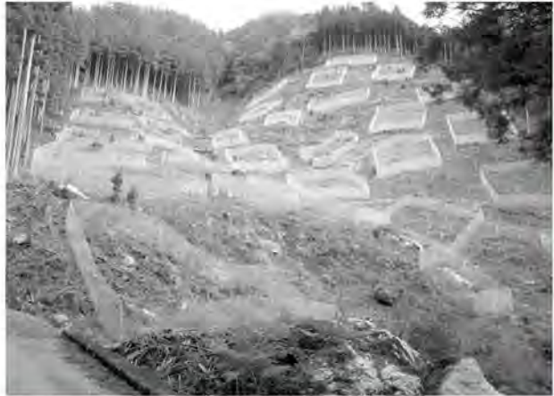
施工されたパッチディフェンス