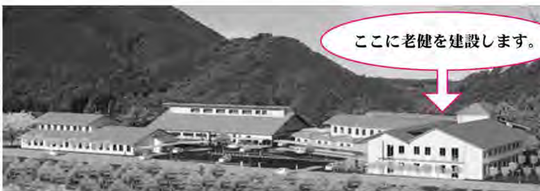
※この図は建設イメージです。各施設のスケール比や施設の形状等の詳細は、実際と異なる部分があります。

しますが、介護老人保健施設の整備・運営費用について、町の財政負担(一般財源)はありません。