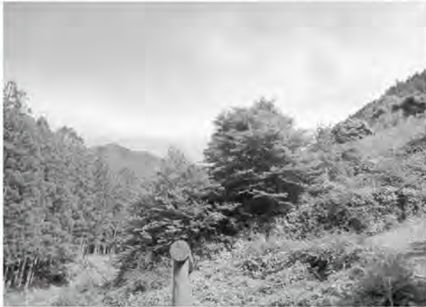
パッチディフェンス内で成長する木々