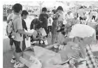
弥起井ほたる祭り