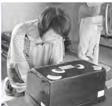
手洗いチェッカーで手洗いができているか確認している様子