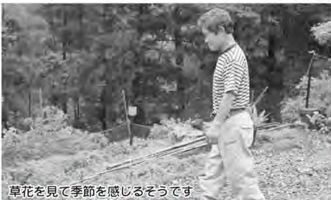
草花を見て季節を感じるそうです

最近ではウォーキングやストレッチをする人も多くなってきているので、続けるコツを伺ったところ、生活リズムの一つとして取り入れることが重要だと言います。「しんどくても歩いたり、ストレッチをしたりしないとあかんと思う。これをしてないと一日が終わらんわ」と語っていました。これからも元気に歩き続けてもらいたいです。