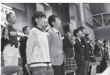
宮川小学校卒業式の様子