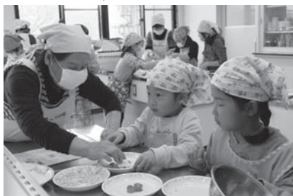
子どもエコクッキングの様子

子どもエコクッキングには19名の子ども達が参加し、楽しみながら環境にやさしい料理を作りました。