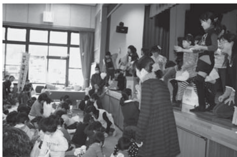
お餅まき、お菓子まき