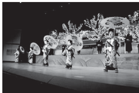
去年行われた「第17回こども歌舞伎発表会」での演目「白浪五人男 稲瀬川勢揃いの場」

東員町教育委員会 社会教育課 ☎0594-86-2816 こども歌舞伎実行委員会(松の会事務局) ☎0594-76-8899