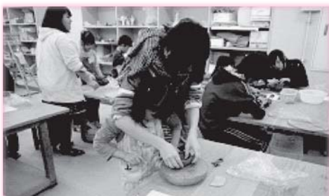
2月19日には宮川小学校2年生の児童11名が昴学園高校を訪れ、昴学園高校2年生の指導のもと、美術の授業とじて陶芸の器づくりを体験しました。

昴学園の生徒が付き、水の分量の測り方や、手を容器から引き出すタイミングなどを教えていました。