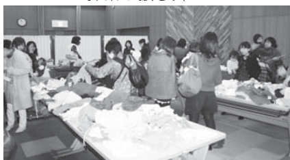
リサイクルコーナー

子ども達によるおどり、太鼓の演奏そして子ども達が点てた抹茶の振る舞いや子供服などのリサイクルコーナーがありました。また、ボランティアさんや高校生によるコリントゲーム、缶バッジ作り、バルーン教室などの様々なコーナーもあり、お父さんお母さんをはじめ、おじいちゃんおばあちゃんまでたくさんの方々が集まり、ゲームや