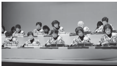
グリーンフレンズによる大正琴の演奏