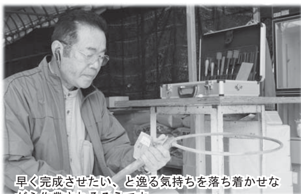
早く完成させたい、と急ぐ気持ちを落ち着かせながら作業されるそうです。

釣りを続けている内に、だんだん自分に合った道具を使いたいと思い始め、10年前からたも作りを始めました。大寒に入るとロープを持って命がけで、たもに使うカヤの木を探しに行きます。その後、木を磨き、型を作り、色をつけるという簡単に聞こえるこの作業ですが、1