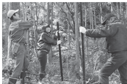
獣害対策ネットを張る様子