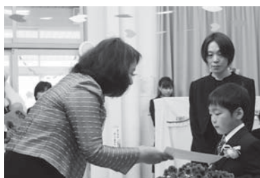
川添保育園卒園式の様子