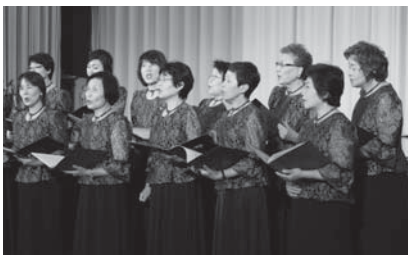
コーラスやまびこによる合唱

会場内には、展示スペースも設けられ、各団体や個人の作品が並び、こちらも賑わいをみせていました。