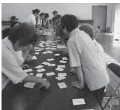
脳のトレーニングの様子 (就業改善センター)

現在、24名の方が登録しており、毎月1回、調整会議を開催し、情報交換や理学療法士による運動指導を受けるなど、介護予防に関する知識の向上に努めています。この内数名のボランティアは、地域の介護予防や健康づくりに取り組み自主グループの活動に参加し運営を支援しており、