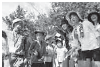
山頂からの景色に目を輝かせる参加者