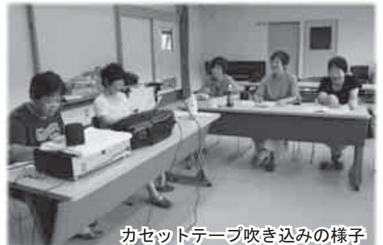
カセットテープ吹き込みの様子

ただ内容を声で吹き込むだけではありません。正確に、また、分かりやすく伝えるため、読解力や発声などの技術向上に努力を惜しみません。この日も「図式をどのように説明したら良いだろう？」「目を閉じて聞いても分かるか？」と相談しながら、原稿を読み合わせている姿が印象的でした。