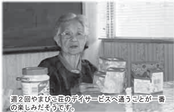
週2回やまびこ荘のデイサービスへ通うことが一番の楽しみだそうです。

ペン立ては大きさや形を変えて研究した結果、7センチ、10センチ、13センチの高さの三角柱を2つずつ組み合わせたものが1番使い勝手が良いということが分かり、その形に定着したそうです。鉛筆やものさしを立てるほか、爪切りや虫眼鏡にも丁度良いサイズで、子どもから大人まで、また家庭でも事務所でも利用でき