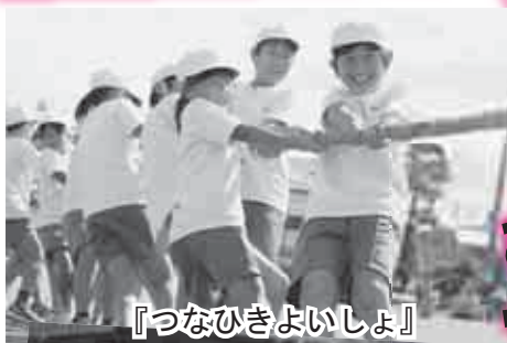
『つなひきよいしょ』