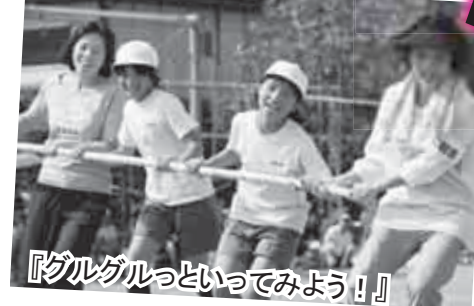
『グルグルっといってみよう！』