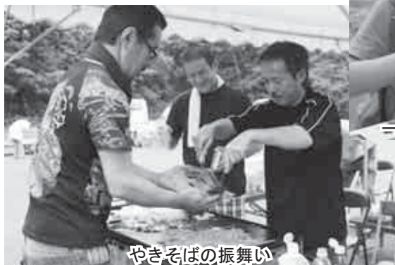
やきそばの振舞い

物知り・達人・ユニークな特技等をお持ちの方を探しています。自薦他薦は問いませんので、役場企画課（☎82-3782）までお知らせください。