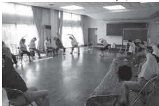
ストレッチ体操の様子(就業改善センター)

参加者の体力や脳機能の維持・改善に取り組みんでいます。楽しくわかりやすい指導で参加者の皆さんからも好評いただいています。今後、さらに高齢化率が高くなることから、介護予防事業は非常に大切な取り組みであり、町では高齢者の皆さんがいつまでもいきいきと健康に暮らせるよう介護予防運動ボランティアを養成していきたいと考えています。介護予防や健康づくりに取り組む自主グループで、運動ボランティアの派遣を希望されるグループがありましたら、役場健康ほけん課までお問い合わせください。