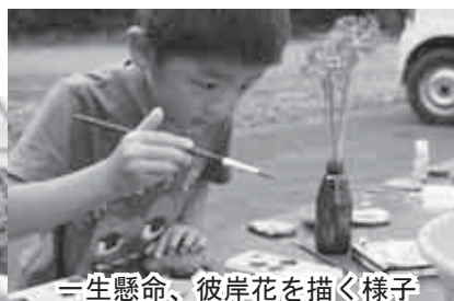
一生懸命、彼岸花を描く様子