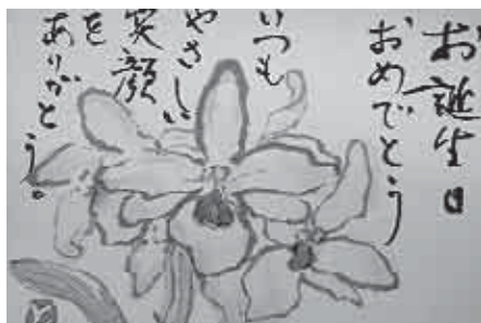
真心のこもった絵手紙

普段の生活の中で地域のために、ふと思いつくことってありますよね。一人ではなかなか行動に移すことは難しくても、バースデー絵手紙のように同じ想いを持つ仲間となら、今日一日だけなら、そう考えれば自分にも何か出来ることがあると改めて感じさせられます。