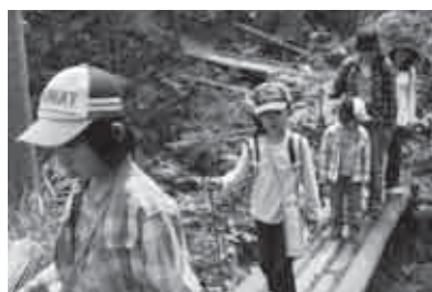
声をかけ合って歩く子ども達

毎年この太平山に登っているという川添小学校の児童は、『あと半分、もう少ししたら楽になるよ。』などの声をかけをしながら、それぞれが自分のペースで山登りを楽しみました。山頂では、目の前に広がる絶景に目を奪われる姿や、おにぎりやお菓子などを食べて楽しむ姿などが見られました。