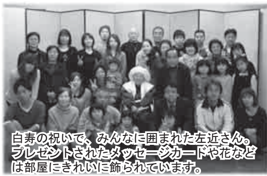
白寿の祝いで、みんなに囲まれた左近さん。プレゼントされたタッセルやカードや花などは部屋にきれいに飾られています。

身体も心も健康な左近さんのほがらかな性格に触れて心が温まりました。いつもまでもそのままでいてください…。