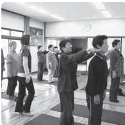
姿勢矯正教室の様子。