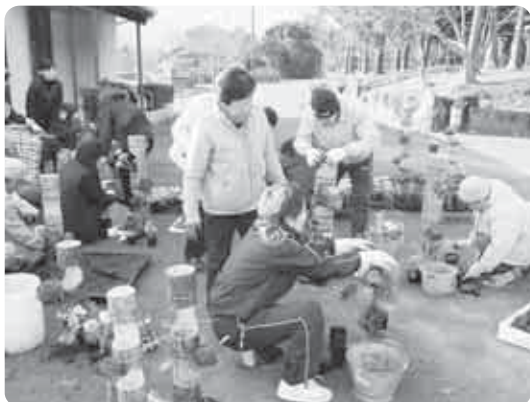
みんなで集まって正月用の花かざりを作ったときの様子。

また、地域の日常で話せる場がない、話しを聞いてくれる人がいない、などの問題をなくすべく、誰でも来やすい居場所を作りたいと、これからまだまだ盛り上がりを見せそうな高奈区でした。