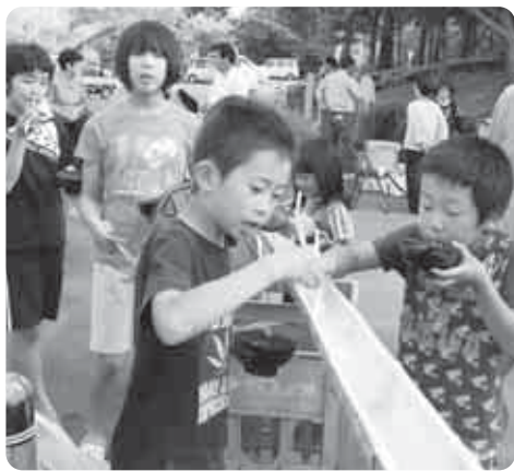
流しそーめんに集まる人々。

一福亭の方々が作るあられやおもちが美味しいのは、昔ながらの手法を取り入れているからだそうです。また、ほたる祭りに恒例で行われる流しそーめんの振舞いも同様です。小さい子から大人まで、参加者はみんな大喜びで竹の周りに集まります。