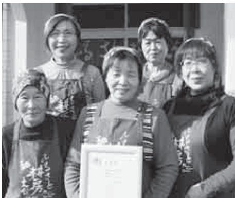
▲「これからも色々作っていかな！」とメンバーのみなさん。おめでとうございます！

このグループは地元農家の女性の方々と構成され、地元のお米、もち米、よもぎ等を原材料に、ネーミングの由来である「周りに内緒で食べたいくらいおいしい」お餅を製造し、「道の駅奥伊勢おおだい」や「奥伊勢パーキングエリア」等で販売しています。また、町内の小学生を対象に餅づくり体験を行うなどの食育活動も行っており、地域の活性化拠点としての活動が評価されました。