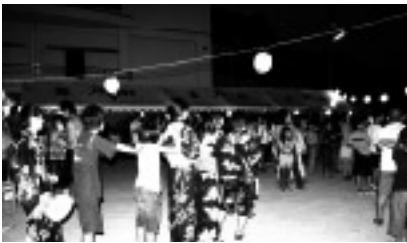
じゃんけん電車に参加する方々

けん電車を参りました。盆踊りの踊り手が少ないので、何とかしたいと考えた結果、じゃんけん電車で輪を作りそ