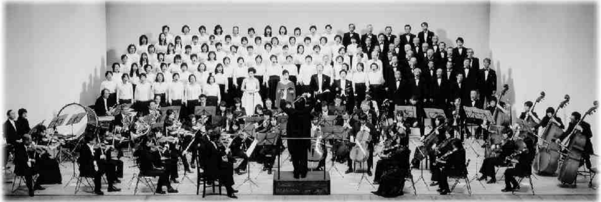
日本語で歌う「第九」 歓喜の歌