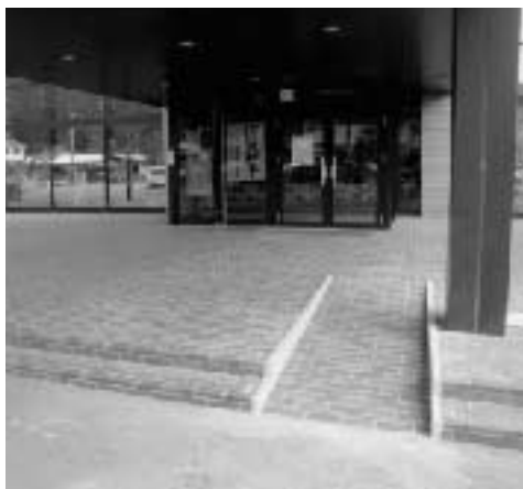
完成した玄関前のスロープ