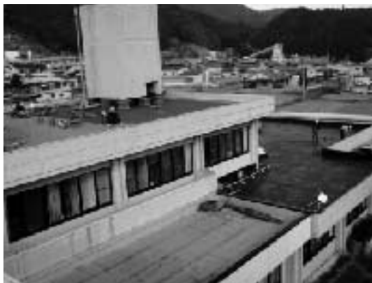
防水工事中の庁舎屋上