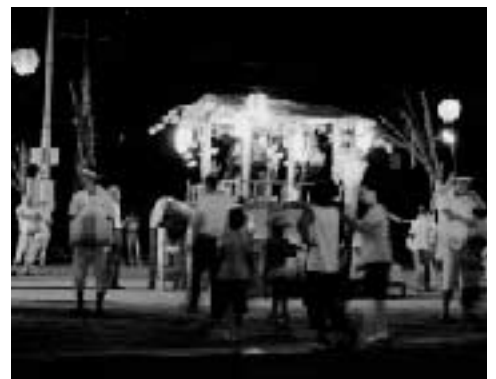
かんこ踊りの様子

施主体を変えつつ近年は保存会で継承されていましたが、平成21年に会員の後継者難等で保存会が解散しました。