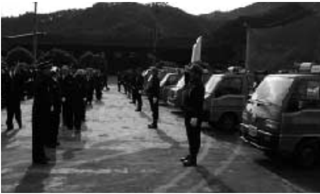
機械器具点検の様子

出初式には消防団員190名が参加。式典では、消防団活動で活躍した団員らの表彰や、消防団から大台町社会福祉協議会へ福祉協力金の贈呈が行われました。式典後は同グラウンドで通常点検と機械器具点検が行われました。