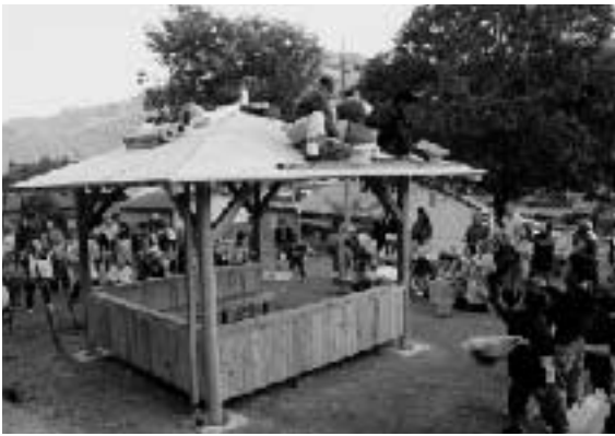
東屋の完成を祝うもちまきの様子

最近女性グループの手によって四季を彩る花々が植えられ、10月には有志の手で東屋も整備されました。