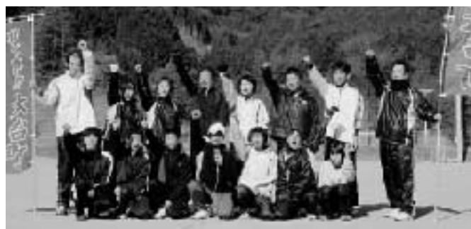
1月18日、多気郡農協から選手の皆さんに、スポーツ飲料を寄贈していただきました。