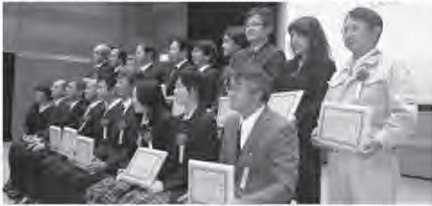
前列右から1番目株式会社環境思考様、 同列右から4番目三交不動産株式会社様 後列右から1番目山田塗装株式会社様、 同列右から3番目株式会社中部システムズ・ウエスト様

今後カーボン・オフセットへの取組みが活発化し、地球温暖化防止などへの意識が高まっていくことを願います。