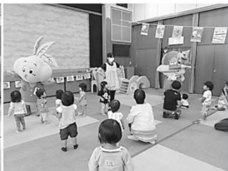
宮坊&チャミーとチャチャチャオーシ!