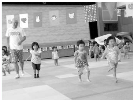
“かけっこ”よーい どん!

9月30日(火)健康ふれあい会館で「ながよし運動会」を開催しました。大勢の家族が参加し、かけっこや玉入れ、ダンスなどの競技を楽しみました。