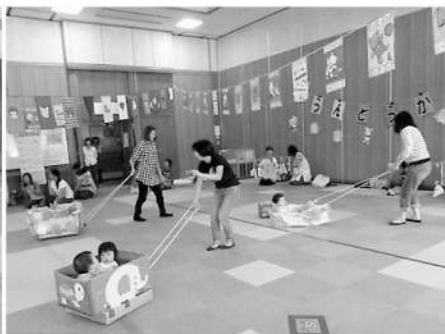
ゴロゴロカーでお散歩