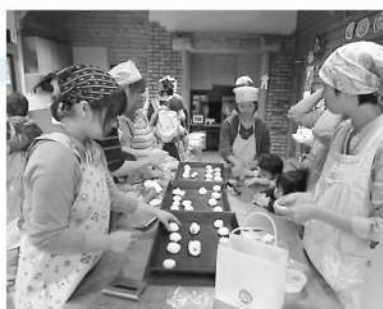
子どもたちも参加! 焼き上がりが楽しみぞろ。

パンが焼きあがると、子どもたちも匂いにつられ、早速美味しそうに頬張っていました。