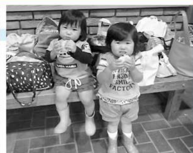
焼きたてパン おいしいな!

問 大台町子育て支援センター ☎83-3500 FAX83-2007 ✉kosodate@odaitown.jp