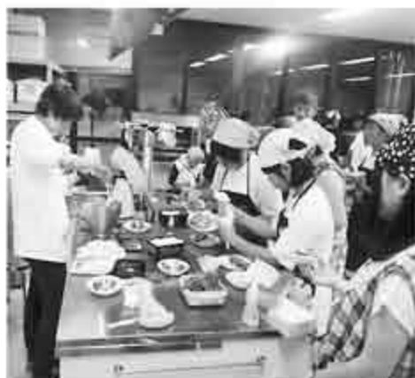
パンケーキづくりの様子

毎月第3木曜日午後7時30分から健康ふれあい会館（大台町粟生）を中心に町内の中学生・高校生が集まって人権問題について学んでいます。あらゆる人権問題について話し合ったり、講師による講演会でお話を聞いたりしています。中学生・高校生の生徒たちは自分の住んでいる町からあらゆる差別をなくしていきつと、また、自分自身の人権感覚を研ごとと真剣に学んでいます。 今年度は、6月、7月にパンケーキ作りを、8月には、デイキャンプ