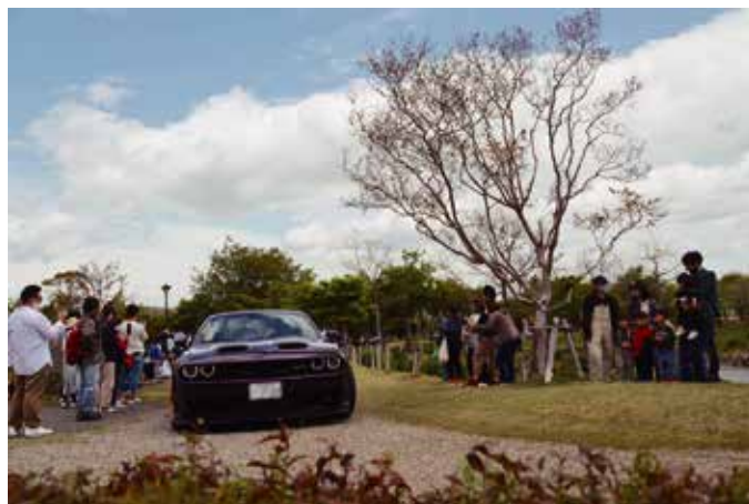
アメ車が集まる様子は圧巻です