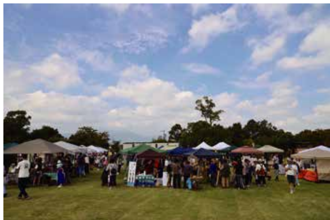
毎回多くの人で賑わうTOINマルシェ