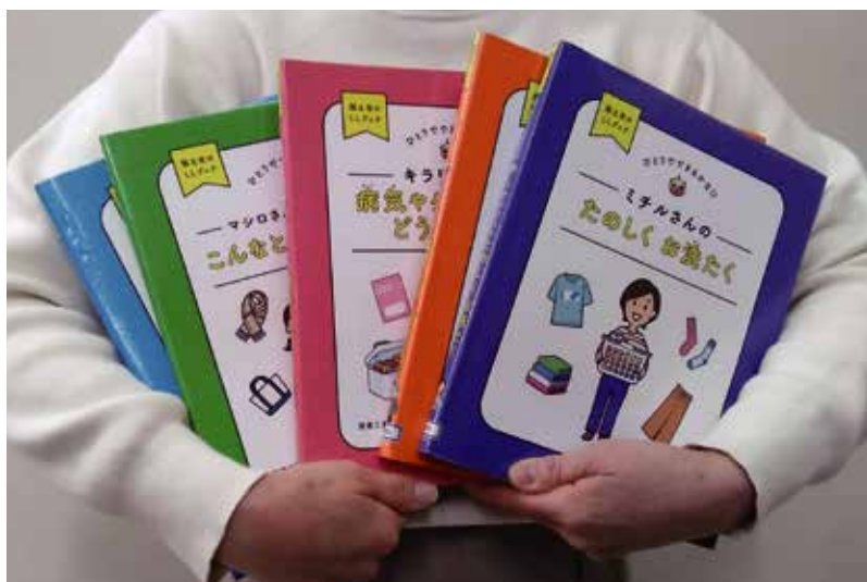
【担当】大台町人権教育研究協議会

ます。知的障がいや発達障がいのある人が、自立生活に必要なスキルを学ぶ際にも活用できると思います。百聞は一見に如かず。ぜひご覧ください。