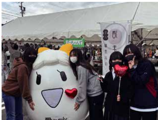
どんとこい大台まつりで記念撮影

このように私はさまざまな経験を通して成長することができ、大台町で過ごした一年間は有意義で充実した一年間でした。