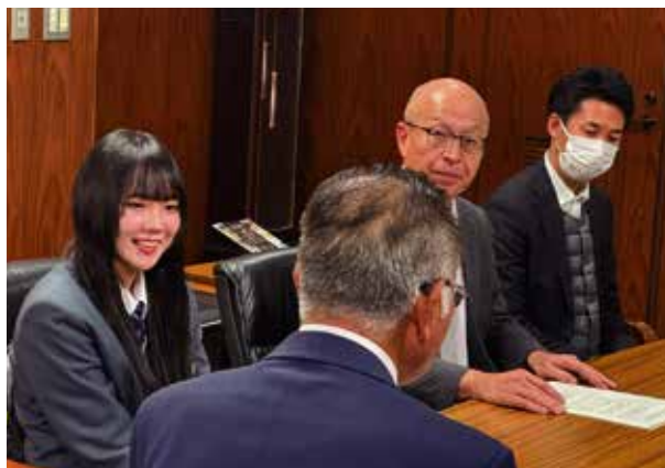
地方創生☆政策アイデアコンテスト2023 地方創生担当大臣賞受章を町長へ報告