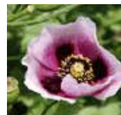
パピバヴェル・セティゲルム種