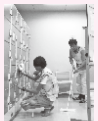
避難所清掃の様子

難所生活が2週間以上も続くのかわかりません。あたりまえの生活のありがたさを忘れることなく、普段から危機管理や防災意識を持つことはもちろんですが、想定される被害への対応についても周りの方々と共有することが大切であると、今回の支援活動を通じて教えていただきました。