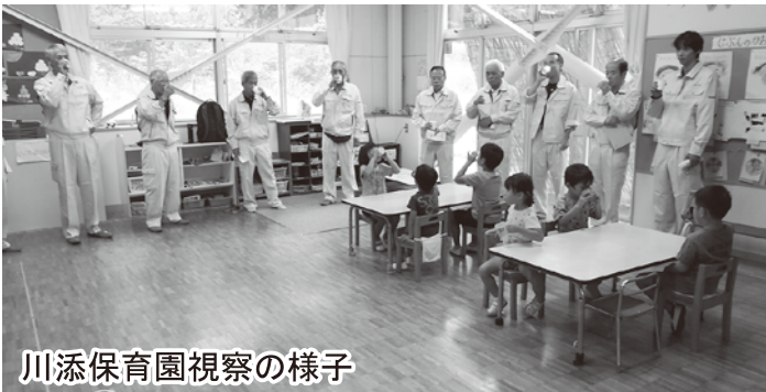
川添保育園視察の様子

9月13日に委員会の調査・研究テーマであるフツ化物洗口について、川添保育園の園児が実施している様子を視察し、その後、日進保育園新園舎の工事現場を視察しました。