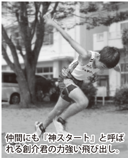
仲間にも『神スタート』と呼ばれる創介君の力強い飛び出し。