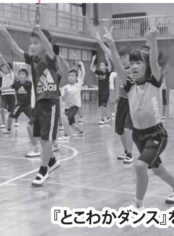
『とこわかダンス』を町内各地で練習中