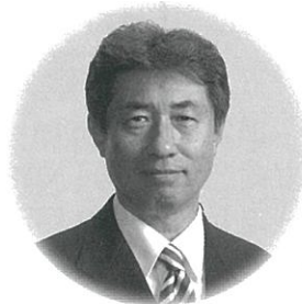
町長 水谷 俊郎

明けましておめでとうございませう。大台町の皆さまには輝かしい新春をお迎えのこととお喜び申し上げます。